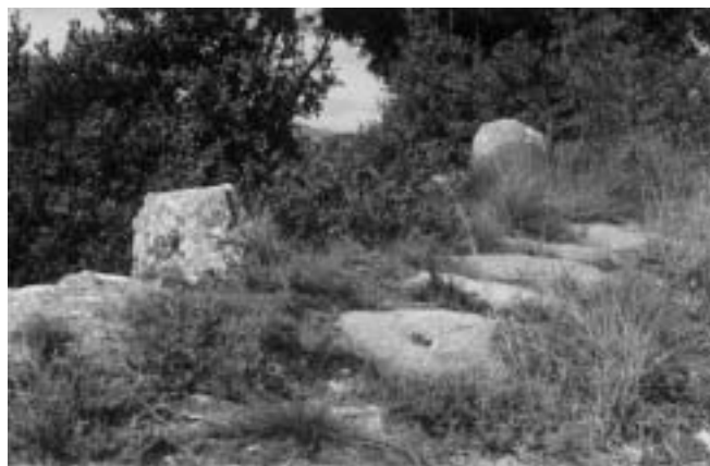
Figura 5. Detall del tram de la via del pla de les Forques, on s'aprecien restes de l'enllosat i dos guarda-rodes encastats al mur de contenció del camí.