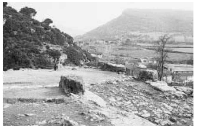
Figura 3. Detall del revolt quadrangular de la via, a la pujada de Sant Antoni, un cop excavat. La foto està presa just abans de la seva destrucció (abril 1988).