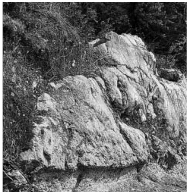
Figura 2. Detall de rodera de la via, corresponent al tram de la pujada de Sant Antoni.

Desitgem, amb el breu treball que presentem, iniciar un estudi que haurà de ser en el futur exhaustiu i aprofundit, i que es marca, com a objectius, reconstruir la nostra història, alertar del perill de destrucció que corre aquest patrimoni i plantejar públicament la necessitat, a mitjà termini, de recuperar, restaurar, senyalitzar i posar a disposició del públic el recorregut de l'antiga via.