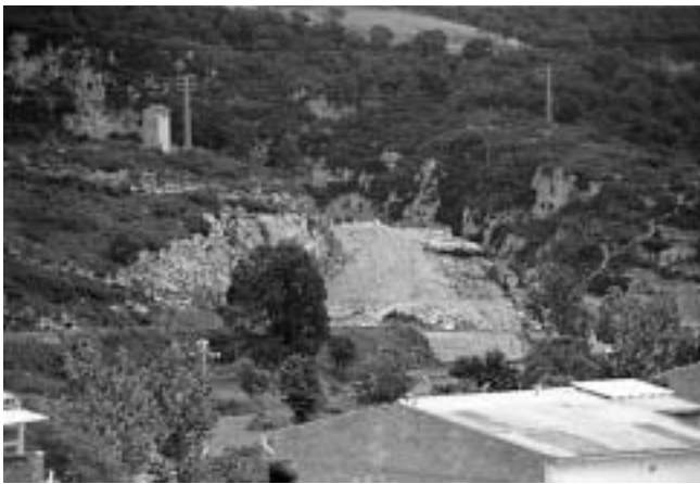
Figura 4. Vista del sector de la via que fou destruït amb motiu de la construcció del nou vial d'entrada a Centelles des de la N-152, amb motiu de la seva ampliació. La foto és del juny del 1988. S'aprecia clarament el traçat descendent de la via tallada a la roca en el tram que encara es conserva.