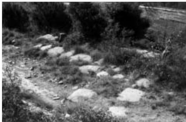
Figura 6. Un altre detall del tram de la via del pla de les Forques, on s'aprecien restes de l'enllosat.

abans d'arribar a la carretera d'accés a la pedrera, en una zona arrassada modernament per màquines excavadores, trobem més restes del mur de contenció de la via.